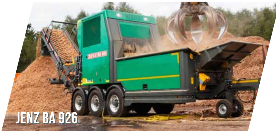
JENZ BA 926