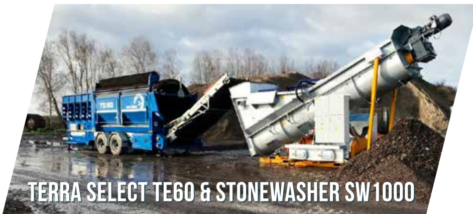
TERRA SELECT TE60 & STONEWASHER SW1000