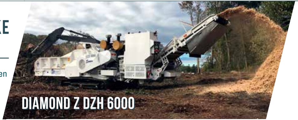
DIAMOND Z DZH 6000