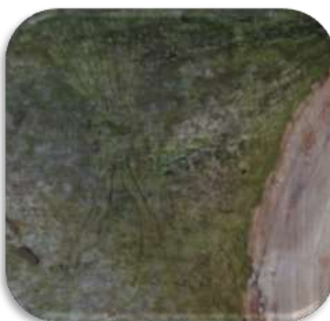
Figuur 2 Gangen onder bast van iep