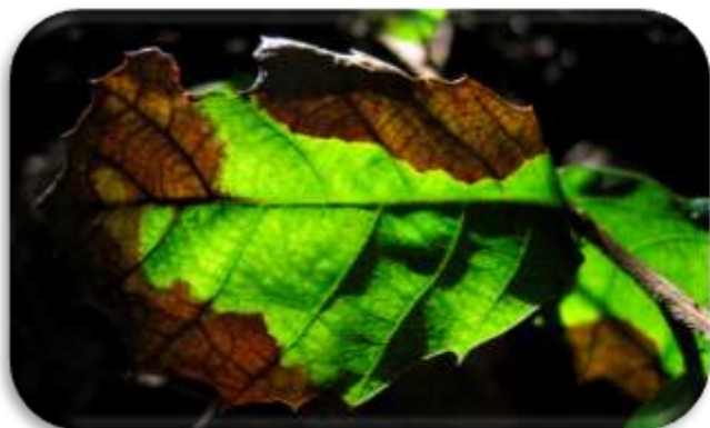
Figuur 2 Besmetting bij Amerikaanse eik

In Nederland is Phytophthora ramorum , een hardnekkige pseudoschimmel, in de buitenruimte gevonden bij de rhododendron, de beuk, bosbessenstruiken en de Amerikaanse eik. Phytophthora ramorum wordt vooral gevonden in beplantingen van rhododendrons in schaduwrijke situaties, waarin de planten langdurig nat blijven (bijv. in de onderbegroeiing van bossen). De schimmel verspreid zich voornamelijk via (opspattend) regenwater en transport van aangetast plantmateriaal en grond. Op afgevallen bladeren en twijgen kan de schimmel langere tijd overleven.