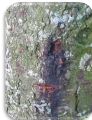
Figuur 1 Roestbruine vlek

Momenteel wordt bij de verwerking van aangetaste bomen de richtlijn voor 'bacterievuur' gevolgd. Deze richtlijn voorziet in de volgende maatregelen: