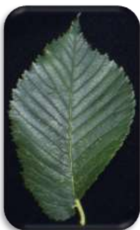
Figuur 1 Blad van iep

Een iep is te herkennen aan de ongelijke bladvoet (zie figuur 1). De iepziekte wordt veroorzaakt door een schimmel die in de houtvaten van de iep leeft en groeit. Als afweermecanisme produceert de aangetaste boom thyllen, een gomblaas om de groei van de schimmel te stoppen. Hierdoor verstoppen ook de eigen houtvaten. Wanneer de schimmel zich over een groot deel van de houtvaten heeft verspreid en deze verstoppen, dan kan de boom binnen enkele dagen afsterven. De schimmel wordt verspreid door de iepenspintkever. In dode, zieke of stervende iepen leggen ze hun eitjes in een gang onder de bast van de iep. Volwassen kevers vreten de okselknoppen van de iep aan. Daarnaast kan de schimmel via wortelcontact overgaan op iepen die in de omgeving staan. Dit maakt de iepziekte zeer besmettelijk. Dood, niet-ontbast iepenhout (na het rooien) kan een ontsmettingshaard zijn. Om het risico van ziekteoverbrenging te minimaliseren is snel en nauwkeurig opruimen van besmette en/of vatbare iepenen broedhout noodzakelijk.