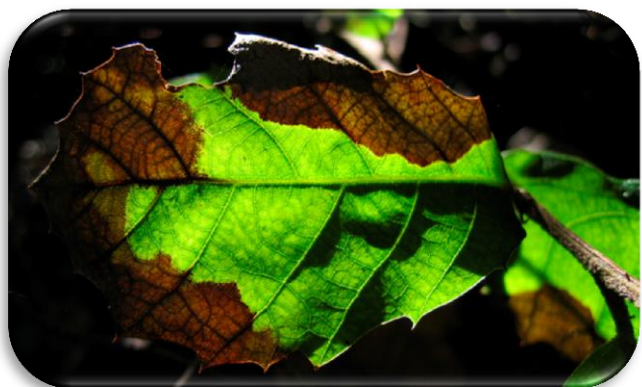
Figuur 4 Besmetting bij Amerikaanse eik

In Nederland is Phytophthora ramorum , een hardnekkige pseudoschimmel, in de buitenruimte gevonden bij de rhododendron, de beuk, bosbessenstruiken en de Amerikaanse eik. Phytophthora ramorum wordt vooral gevonden in beplantingen van rhododendrons in schaduwrijke situaties, waarin de planten langdurig nat blijven (bijv. in de onderbegroeiing van bossen). De schimmel verspreid zich voornamelijk via (opspattend) regenwater en transport van aangetast plantmateriaal en grond. Op afgevalen bladeren en twijgen kan de schimmel langere tijd overleven.