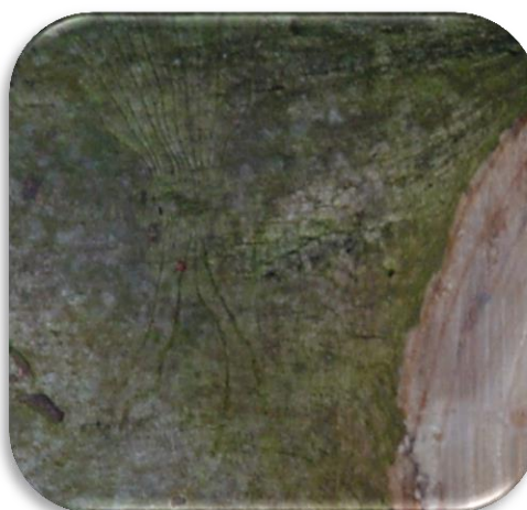
Figuur 1 Gangen onder bast van iep