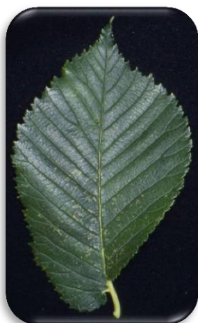
Figuur 2 Blad van iep

Een iep is te herkennen aan de ongelijke bladvoet (zie figuur 1). De iepziekte wordt veroorzaakt door een schimmel die in de houtvaten van de iep leeft en groeit. Als afweermecanisme produceert de aangetaste boom thyllen, een gomblaas om de groei van de schimmel te stoppen. Hierdoor verstoppen ook de eigen houtvaten. Wanneer de schimmel zich over een groot deel van de houtvaten heeft verspreid en deze verstoppen, dan kan de boom binnen enkele dagen afsterven. De schimmel wordt verspreid door de iepenspintkever. In dode, zieke of stervende iepen leggen ze hun eitjes in een gang onder de bast van de iep. Volwassen kevers vreten de okselknoppen van de iep aan. Daarnaast kan de schimmel via wortelcontact overgaan op iepen die in de omgeving staan. Dit maakt de iepziekte zeer besmettelijk. Dood, niet-ontbast iepenhout (na het rooien) kan een ontsmettingshaard zijn. Om het risico van ziekteoverbrenging te minimaliseren is snel en nauwkeurig opruimen van besmette en/of vatbare iepenen broedhout noodzakelijk.