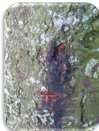
Figuur 3 Roestbruine vlek

Momenteel wordt bij de verwerking van aangetaste bomen de richtlijn voor 'bacterievuur' gevolgd. Deze richtlijn voorziet in de volgende maatregelen: