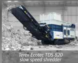
Terex Ecotec TDS 820 slow speed shredder