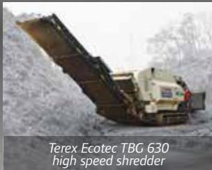
Terex Ecotec TBG 630 high speed shredder

Volgende machines zijn te bezichtigen op de BVOR-demodagen: