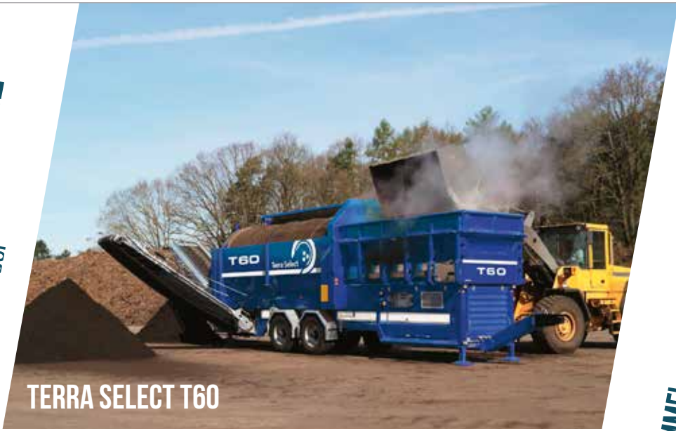
TERRA SELECT T60