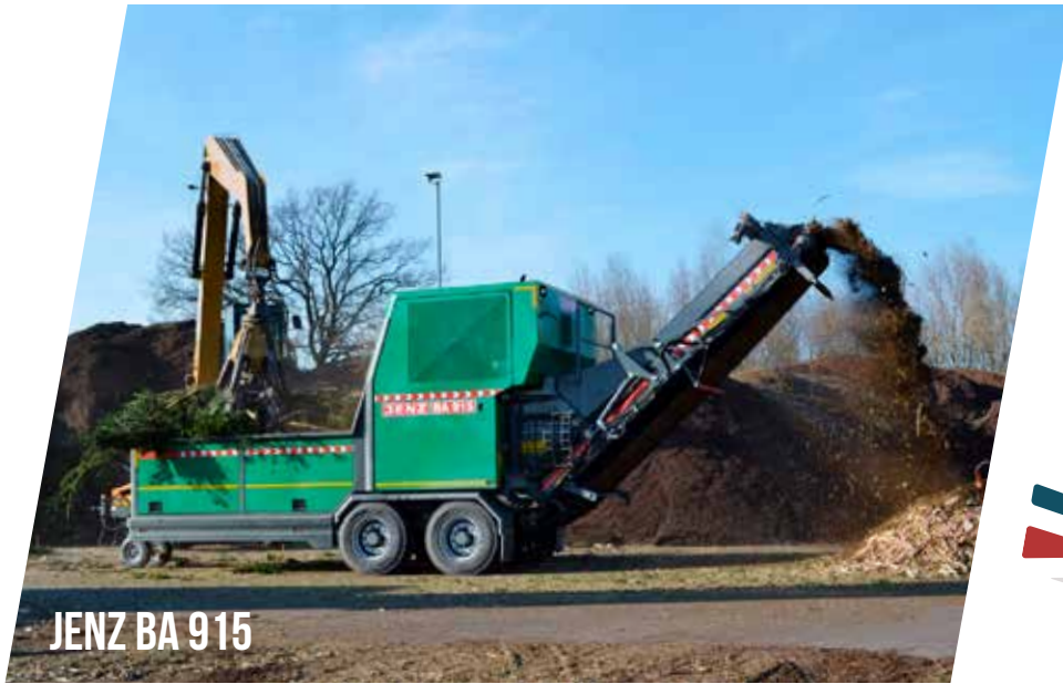
JENZ BA 915