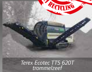
Terex Ecotec TTS 620T trommelzeef