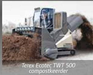
Terex Ecotec TWT 500 compostkeerder